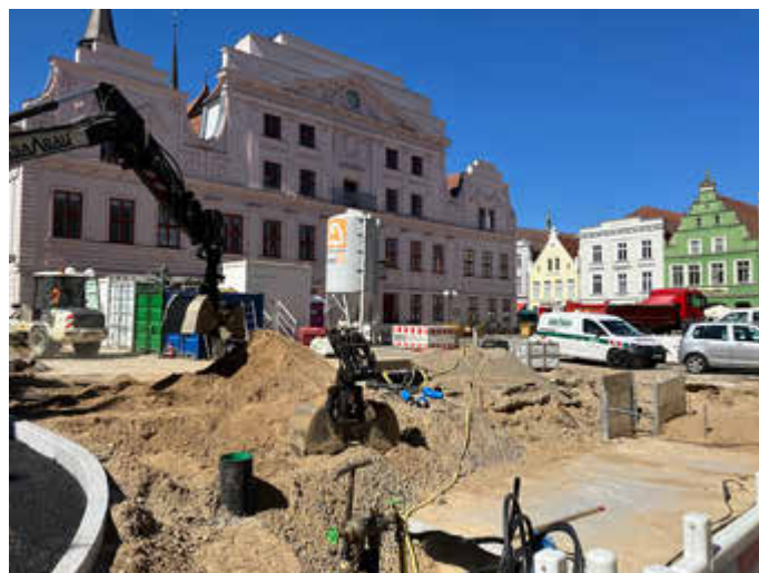
Foto: Baustelle am 13.08.2024