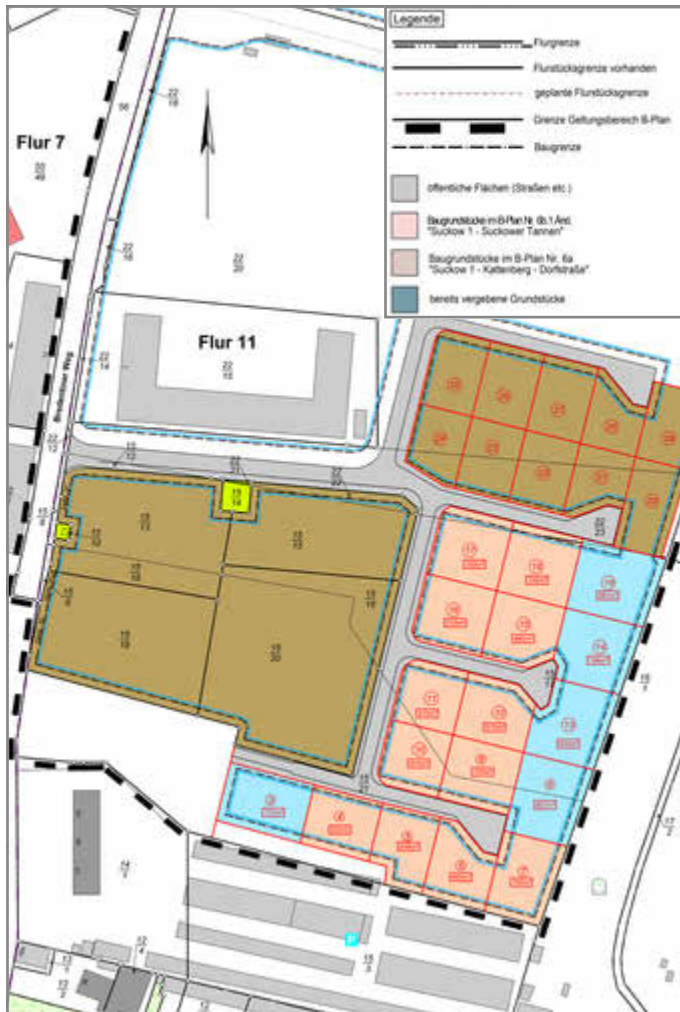
Übersichtsplan Baugebiet „Petershof“

Die Baugrundstücke im Baugebiet „Petershof“ , 1. Bauabschnitt, befinden sich im Bereich des rechtskräftigen Bebauungsplans Nr. 67. Der aktuelle Durchschnittspreis liegt derzeit bei 161,00 €/m 2 (Stand 08/2024). Der Erwerb ist an eine Bauverpflichtung innerhalb von 3 Jahren geknüpft. Die Parzellen 9 und 10 sind mit einem dinglichen Anspruch (Leitungsrecht) belegt.