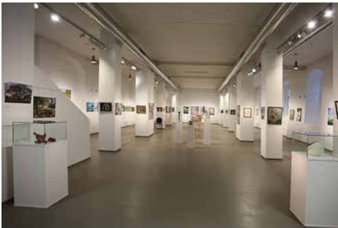
Foto: Blick in die 3. Laienkunstaussstellung, © Prof. Gunter Rambow, 2022

Die Ausstellung ist vom 3. Oktober 2024 bis 5. Januar 2025 täglich in der Zeit von 11:00 - 17:00 Uhr zu sehen. Abweichungen zu den Feiertagen (Weihnachten, Neujahr) sind möglich.