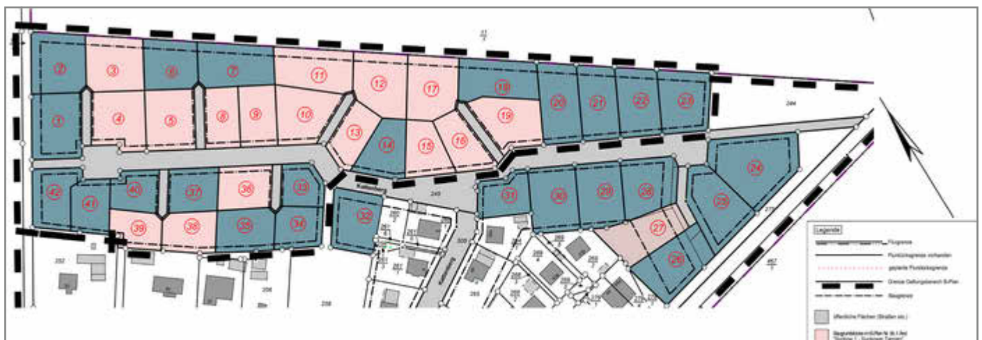
Übersichtsplan Baugebiet „Suckower Tannen“

Die Baugrundstücke im Baugebiet „Suckower Tannen“ befinden sich im Bereich der rechtskräftigen Bebauungspläne Nr. 6a und 6b. Der aktuelle Durchschnittspreis liegt derzeit bei 118,74 €/m 2 (Stand 08/2024). Der Erwerb wird an eine Bauverpflichtung innerhalb von 5 Jahren geknüpft.