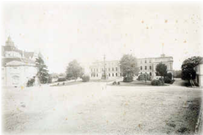
Foto: Der Schlossplatz (Franz-Parr-Platz) vor 1877, Barlachstadt Güstrow

Das Stadtmuseum als unmittelbarer Anlieger des Platzes beteiligt sich an den geplanten Veranstaltungen zum Tag des offenen Denkmals mit einer kleinen Ausstellung von historischen Fotografien von den Gebäuden am Franz-Parr-Platz, darunter sehr frühen Aufnahmen des Güstrower Schlosses und vom benachbarten Gerichtsgebäude. Das heutige Museum entstand in den 1820er-Jahren als Krankenhaus des Landarbeitshauses, das seit 1817 im Schloss untergebracht war. Obgleich es ein Zweckbau war, erhielt es eine repräsentative Gestaltung im klassizistischen Stil, der in Güstrow prägend für die ersten Jahrzehnte des 19. Jahrhunderts war.